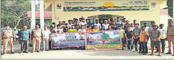
भ्रमण के दौरान मौजूद वन विभाग के अधिकारी और छात्र-छात्राएं।