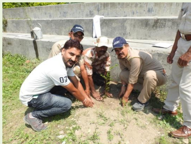
जिलाधिकारी व पुलिस अधिकक्षक उत्तरकाशी द्वारा वृक्षारोपण करते हुए।