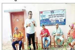
विलहौर में पौधारोपण के बारे में जनकारी देने प्रमुख लोग। स्याद