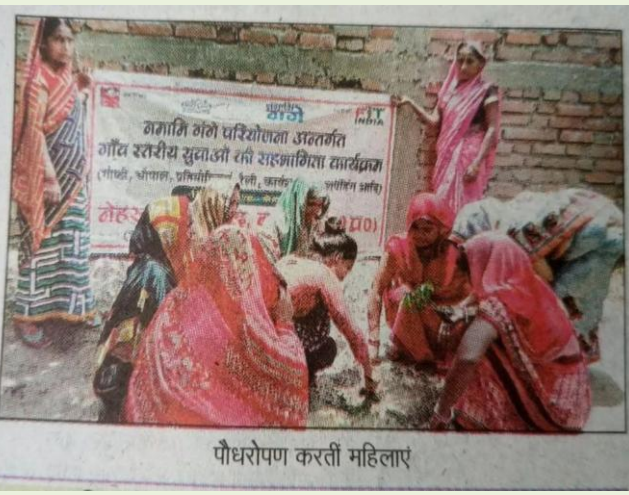
पौधरोपण करती महिलाएं