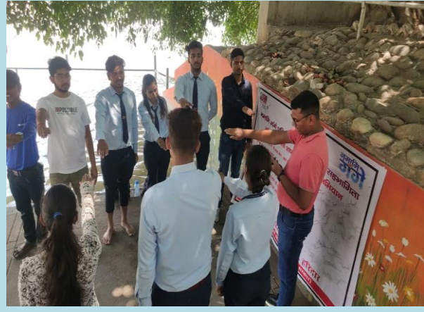
हरिद्वार में प्रेम नगर घाट पर शपथ, स्वच्छता, हस्ताक्षर अभियान में प्रतिभाग करते युवा