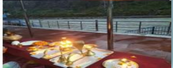
उत्तरकाशी में आयोजित गंगा जयंती के उत्सव पर पंजाब सिन्ध क्षेत्र घाट एवं जोशियाडा गंगा घाट पर गंगा आरती एवं दीपोत्सव के आयोजन का एक दृश्य