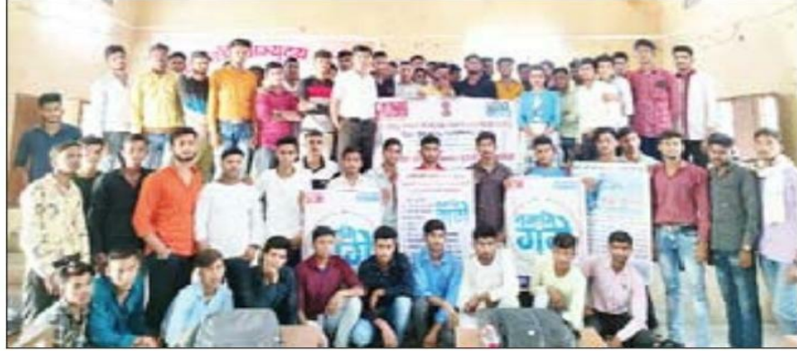
फर्रुखाबाद : कार्यक्रम में शामिल युवा।