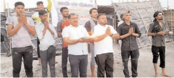
गजरौला। नेहरू युवा केंद्र अमरोहा एवं नमामि गंगे के संयुक्त तत्वाधान में सोमवार को गंगा सप्तमी के अवसर पर गंगा आरती एवं योगा कार्यक्रम, गंगाधाम तिगरी घाट पर आयोजित किया गया। जिला परियोजना

जनमानस से गंगा की स्वच्छता का किया आह्वान