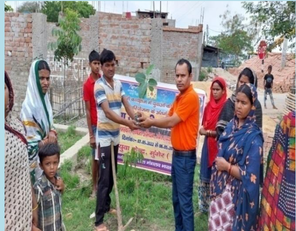
नेहरू युवा केन्द्र, मुंगेर में गंगा जयन्ती के अवसर पर विभिन्न गतिविधियां करते युवा