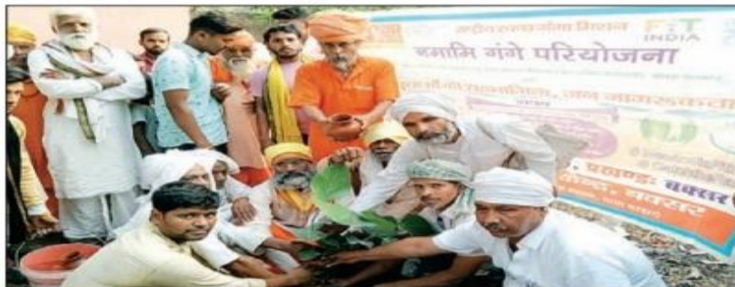
शपथ के साथ वृक्षारोपण करते नमामि गंगे से जुड़े लोग।

गांव के बीच संत रविदास मंदिर के प्रांगण में स्थानीय ग्रामवासी के सहयोग से वृक्षारोपण कर गांव के पर्यावरण को स्वच्छ रखने हेतु संकल्प लेकर अधिक से अधिक वृक्ष लगाने का कार्य किया जायेगा। गंगा की स्वच्छता हेतु शपथ के दौरान ग्रामवासी गंगा में साबुन सर्फ का प्रयोग नहीं करने का, कूड़ा कचरा व गंदगी नहीं करने का संकल्प लिया। जिससे लोगों से स्वच्छ ग्राम स्वच्छ गंगा की ओर एक कदम बढ़ाते हुये नागरिकों को