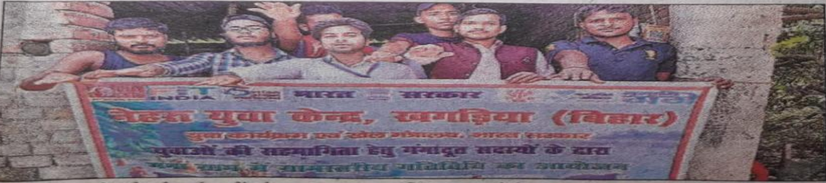
शनिवार को बौरने गांव में गंगा स्वच्छता की शपथ लेते युवा।