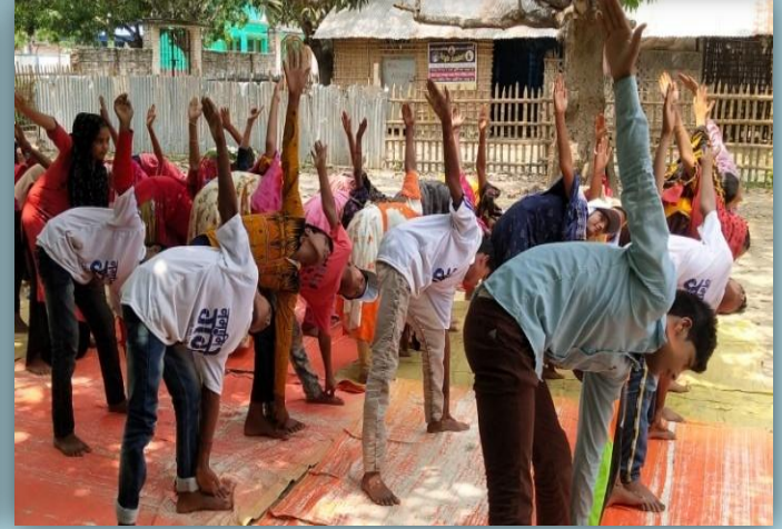
गंगा जंयती के अवसर पश्चिम बंगाल में गंगा जयंती के अवसर पर रैली निकालते, वृक्षारोपण करते एवं योग करते युवा