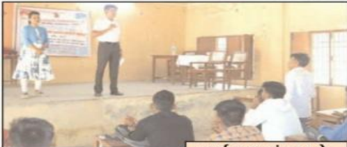
युथ इण्डिया संवाददाता,

फर्रुखाबाद। नेहरू युवा केंद्र के तत्वावधान में नमामि गंगे परियोजना के अंतर्गत गंगा जयंती के अवसर पर एमआईसी फतेहगढ़ में गोष्ठी एवं जागरूकता कार्यक्रम का आयोजन किया गया।