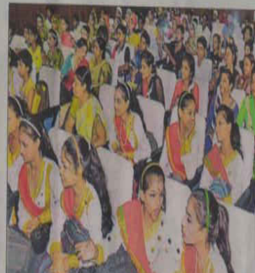
रिववार को कार्यक्रम के दौरान अपने प्रतिभाग का इंतआर करते बच्चे। 🌞 हिन्दुरतान

अन्य जगह लगने वालों बाजारों में तिरंगे वित्य तैयारियां की गई।