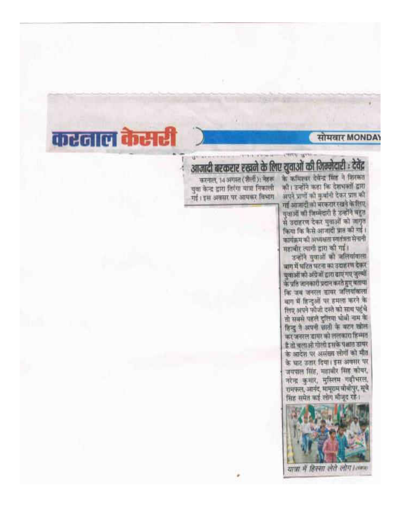
Nehru Yuva Kendra Sangathan, Ministry of Youth Affairs & Sports, Govt. of India