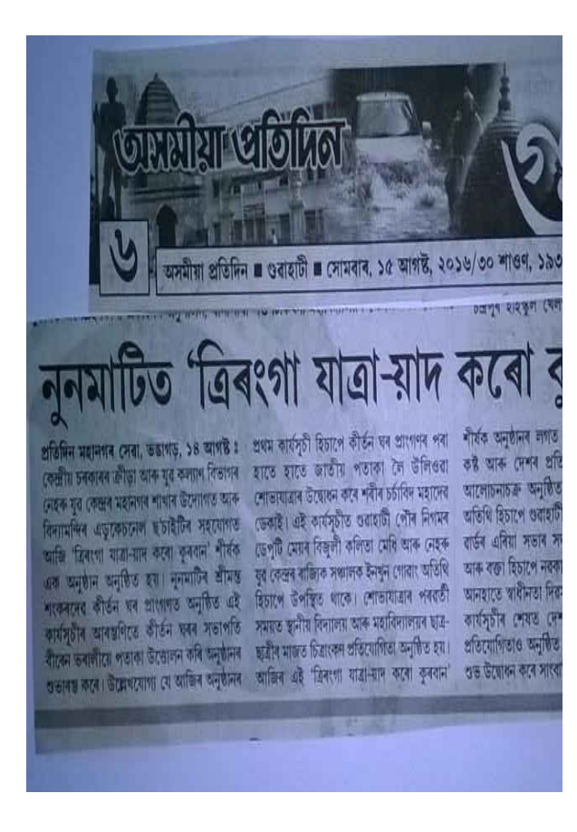
Nehru Yuva Kendra Sangathan, Ministry of Youth Affairs & Sports, Govt. of India