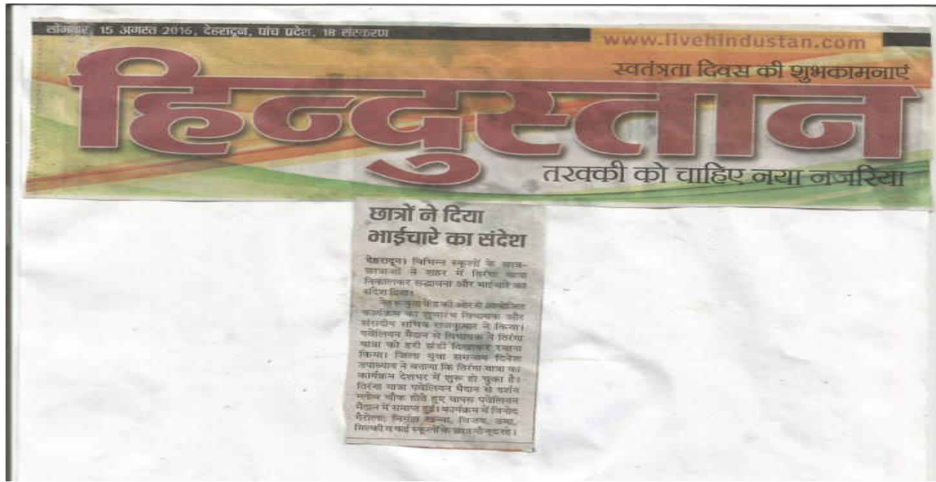
Nehru Yuva Kendra Sangathan, Ministry of Youth Affairs & Sports, Govt. of India