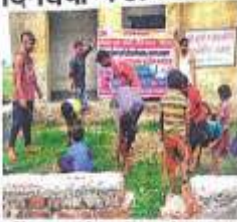
स्वच्छता हमारे जीवन का अभिन्न हिस्सा है। हमें अपने घर या आसपास स्वच्छता रखनी चाहिए। इसे दिनचर्या में अपनाएं।

स्वच्छता हमारे जीवन का अभिन्न हिस्सा है। हमें अपने घर या आसपास स्वच्छता रखनी चाहिए। इसे दिनचर्या में अपनाएं। स्वच्छता हमारे जीवन का अभिन्न हिस्सा है। हमें अपने घर या आसपास स्वच्छता रखनी चाहिए। इसे दिनचर्या में अपनाएं। स्वच्छता हमारे जीवन का अभिन्न हिस्सा है। हमें अपने घर या आसपास स्वच्छता रखनी चाहिए। इसे दिनचर्या में अपनाएं।