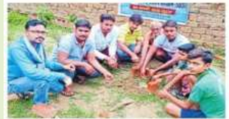
गमनगर में पौधरोपण करते युवा।