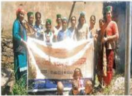
काय वार्षिक में स्वच्छता करने वाली महिलाओं ने तनी को जागरूक भी किया।