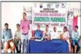
స్వచ్ఛభారతీ కార్యక్రమం నిర్వహించిన సందర్భంగా

అంతం కృషి (అవినీతి నిర్మూలన), మ్యూజియం: పచ్చని పంట పంటలను యువకేంద్రం ద్వారా నిర్వహించారు. ఈ సందర్భంగా ముఖ్య అధికారి వారు స్వచ్ఛభారతీ కార్యక్రమం గురించి వివరాలు తెలియజేసి, దీనిని ప్రోత్సహించారు. ఈ సందర్భంగా వారు స్వచ్ఛభారతీ కార్యక్రమం గురించి వివరాలు తెలియజేసి, దీనిని ప్రోత్సహించారు.