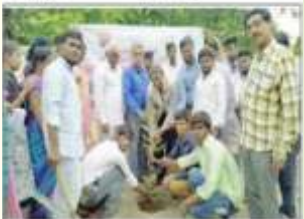
మొట్టమొదటి స్వచ్ఛభారతీ కార్యక్రమం నిర్వహించిన సందర్భంగా

స్వచ్ఛభారతీ కార్యక్రమం నిర్వహించిన సందర్భంగా ముఖ్య అధికారి వారు స్వచ్ఛభారతీ కార్యక్రమం గురించి వివరాలు తెలియజేసి, దీనిని ప్రోత్సహించారు. ఈ సందర్భంగా వారు స్వచ్ఛభారతీ కార్యక్రమం గురించి వివరాలు తెలియజేసి, దీనిని ప్రోత్సహించారు.