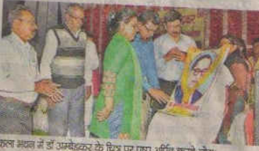
कला भवन में डॉ. अंबेडकर के चित्र पर पुष्प अर्पित करते लोग

नेहरू युवा केंद्र के तत्वावधान में मंगलवार को कला भवन में संविधान निर्माता डॉ. भीमराव अंबेडकर की 125वीं जयंती के मौके पर युवा सम्मेलन का आयोजन किया गया। इसमें वक्ताओं ने डॉ. अंबेडकर के जीवन और आदर्शों पर प्रकाश डाला। वक्ताओं ने कहा कि वे एक राजनीतिज्ञ के साथ-साथ समाजसेवी भी थे। समाज के तरक्की और विकास को लेकर वे विशेष रूप से चिंतित रहते थे। उन्होंने समाज के दलित और शोषित वर्गों को उनका अधिकार दिलाने के लिए संविधान में कई प्रावधान किए। इस मौके पर डॉ. एसएल वर्मा ने उनके जीवनों पर प्रकाश डाला। उन्होंने कहा कि वे एक महान व्यक्ति थे। उनका जन्म महाराष्ट्र में हुआ था। उन्होंने अमेरिका के कैलिफोर्निया विश्वि में पढ़ाई पूरी कर एमए और डॉक्टरेट की उपाधि ली। इंग्लैंड में उन्होंने वकालत की पढ़ाई की। समारोह के मुख्य अतिथि एनवाईके के उप निदेशक बीएस पांडे ने युवाओं से भारत सरकार की योजनाओं के बारे में जन-जन तक पहुंचाने की बात कही। डॉ. अंबेडकर के जीवन पर प्रकाश डाला। इस मौके पर डॉ. छोटे लाल नहरदार, स्वाति वैश्यनी, विमल कोचर, कमर वादत, ऋतुराज बंसत, अभिषेक आनंद, अक्षय, संजय गौजुद थे।