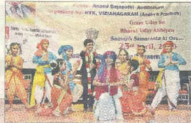
చిన్నారుల నృత్య ప్రదర్శన

ణతో వీణ్యారులు, పెద్దలు స్వచ్ఛరూపణాలను ప్రదర్శించారు. సర్దనశాల, శ్రీ మయూరి, వైప్రవి కళానికేతనకు చెందిన విద్యార్థులు దేసిన ప్రద