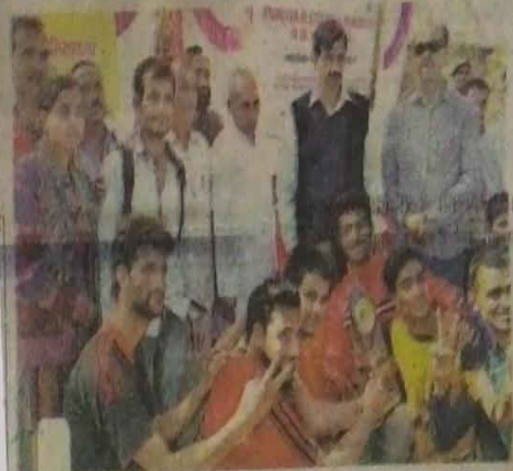
विजेता वालीबाल की टीम को पुरस्कृत करते विधायक व अन्य।