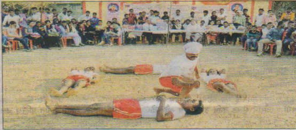
खेलकूद स्पर्धा के दौरान आखाड़े का प्रदर्शन करते खिलाड़ी।