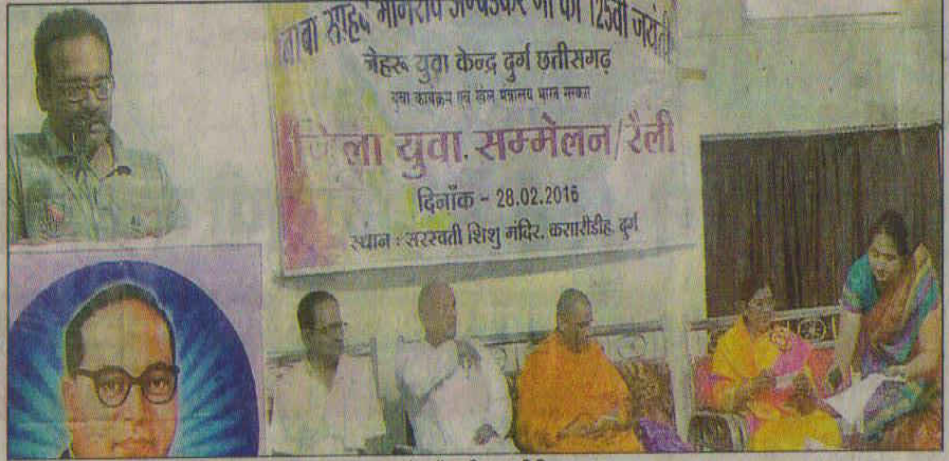
समारोह में उपस्थित अतिथिगण