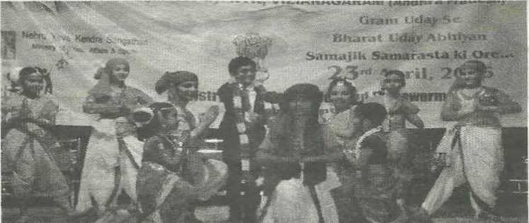
యువ సమ్మేళనంలో సాంస్కృతిక కార్యక్రమాలు